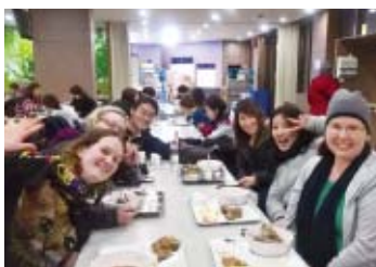
活動以外にもいろんな国の人と過ごした