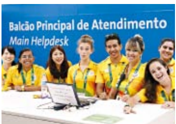
チームメンバーと撮った写真は大切な思い出