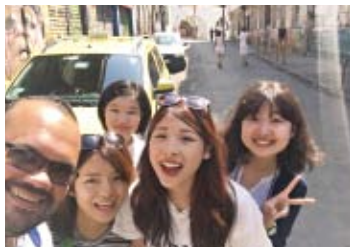
観光をしたりビーチに行ったり、活動以外の時間も楽しんだ

約3週間、MPC(メインプレスセンター)で、各国報道機関の対応を担当していました。一緒に活動したメンバーも各国から集まっていて、フランス、ロシア、中国、韓国、ブラジルと多国籍! こうした、いろいろな国からきた仲間と友達になれたことも良い思い出です。また、休憩時間やお休みを利用して、競技観戦やリオ観光を楽しみました。リオの街全体がお祭りムードに包まれていて、そうした熱気を感じられたことも良かったです。