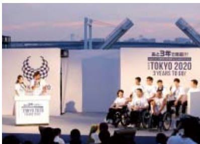
東京2020パラリンピック3年前カウントダウンイベントの様子

東京2020パラリンピック開催のちょうど2年前となる8月25日(土)に、カウントダウンイベントを開催。パラリンピック競技の体験ができるコーナーや、パラリンピック競技のルールやアスリートを紹介するコーナーなどを予定しています。夏休み最後の土曜日、みなさんぜひご参加ください。