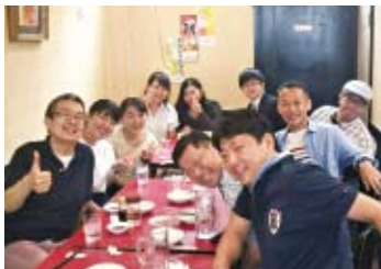
今も関係が続く仲間たちとの食事

ボランティアに参加したからこそ出会えた仲間は、私にとっての財産。多くの仲間とチームとして活動したからこそ得られるものがたくさんありました。大会時、夜の宿舎にて「今日もお疲れさま」と、乾杯した仲間は、20年経った今でも、変わらずに笑いあえる友達です。