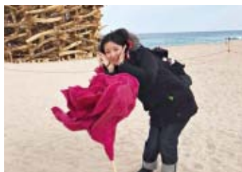
期間中には海での観光も

スポーツパレルのメーカーに勤めているので、仕事とはまた違った角度でスポーツに関わりたいたいと思い、ボランティアに参加。業務上、展示会やイベントに関わる機会はありませんでしたが、この世界的な大イベントの運営に携われたことで、会場の雰囲気をつくる観客の大切さ、関わる人への感謝を改めて感じました。また、仕事では出会わないであろう企業の方との出会いもたくさんあり、さまざまな人脈を築けたと感じます。この経験や出会いを、今後仕事に活かせたらと考えています。