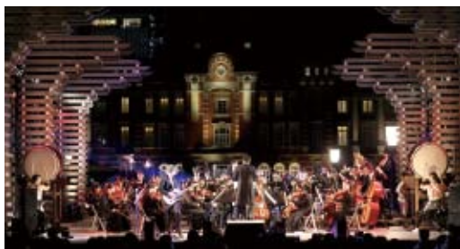
2017年11月に行われた文化オリンピアードナイトの様子