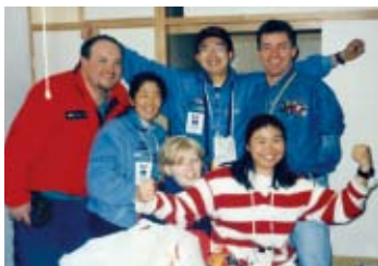
長野1998当時のチームスタッフと

早く終わる日には、試合を見 に行ったり、仲間たちと近く の居酒屋に行ったりしました。