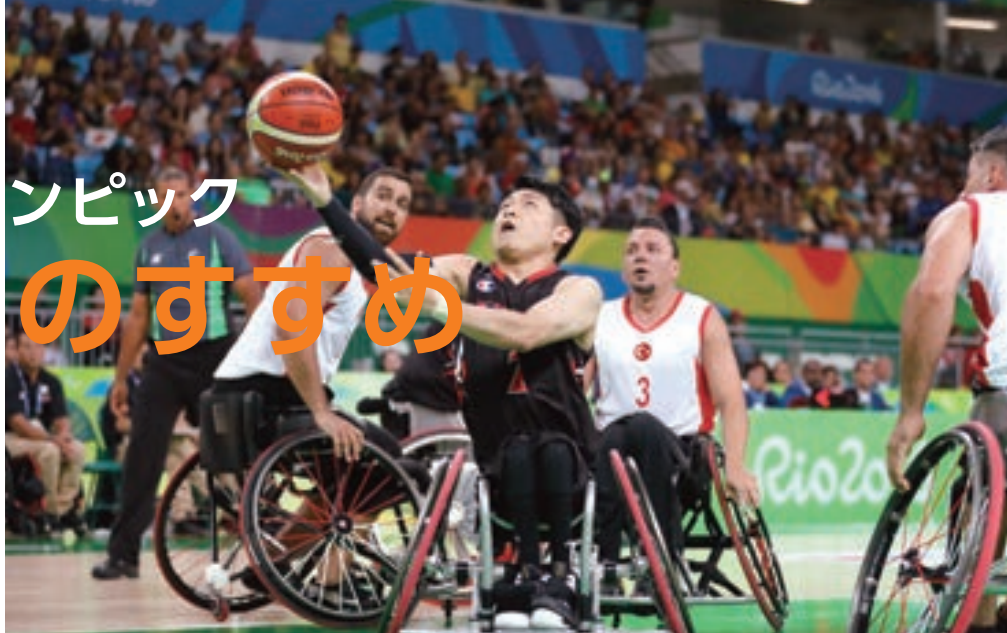
リオ2016パラリンピック、車いすバスケットボールの様子

※2018年12月時点の予定を基にしています。今後変更が生じる可能性もありますので、ご了承ください。