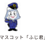
山梨県警マスコット「ふじ君」

東京2020オリンピック・パラリンピック自転車競技 (ロード) 開催! 【オリンピック】 2020年7月25日(土) ~ 26日(日)・29日(水) 【パラリンピック】 2020年9月1日(火) ~ 4日(金)