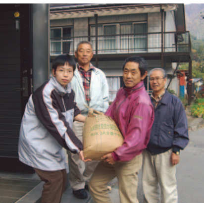
福祉センターに贈呈

道志村稲作体験の会の皆さんが今年も収穫した米を11月6日に公共施設の福祉センター・保育所・給食センターに贈呈しました。今回収穫した米は400kgと昨年より多く収穫され、道志村の澄み切った空気と山間を流れる清らかな水で美味しいお米となり頂いた皆さんはとても喜んでいました。