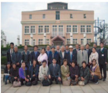
水道記念館前での集合写真

今後も新たな企画で実施していきたいと考えていますので、ご協力をお願い致します。 友好交流事業3回の結果をスナップ写真でご報告いたします。