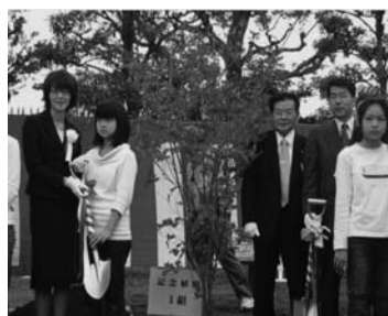
野田副市長（左）と村長、議長