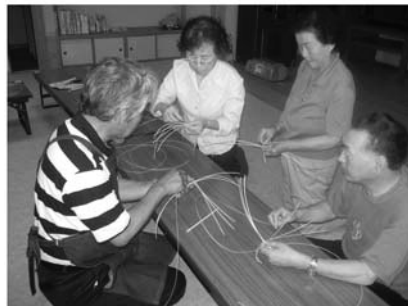
●【かごの基礎を覚える為の指導】●