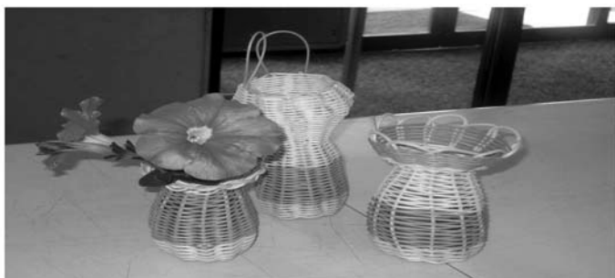
● ヤクルトの空き容器を使つての花カゴ ●