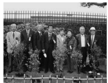
議員代表と村民代表の植樹