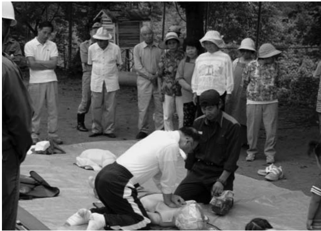
9月2日に行われた道志村総合防災訓練（久保会場）