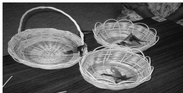
● ちょっと大きめのカゴ ●