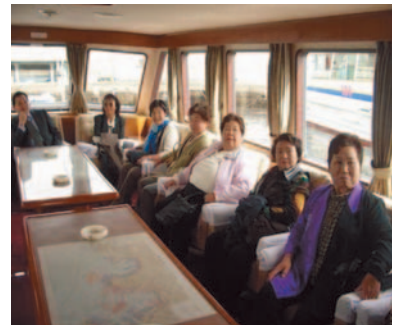
はまどり・おとりに乗船しての横浜港周遊