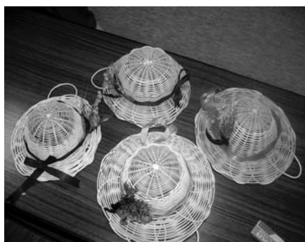
● 帽子の形の壁飾り ●