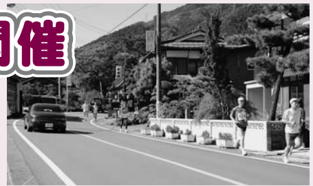
10キロは国道から林道を走る