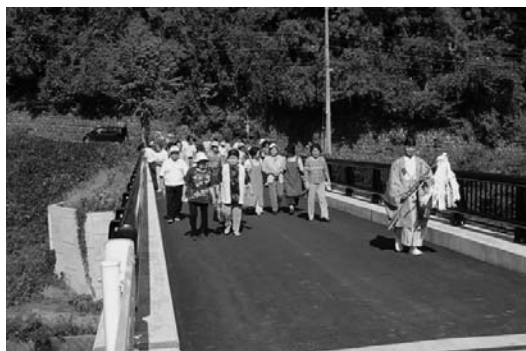
新田代橋を全員で渡りました

新田代橋の完成 9月28日に新田代橋の渡り初めが行われました。 旧田代橋は昭和40年代に施工されましたが老朽化に伴い、新田代橋の新設となりました。 この新田代橋は平成16年9月からの着工となり、橋の事業としては、中山間事業で行われ総事業費85,000,000円 施工業者は長田産業㈱・志村工業㈱・飯田鉄鋼㈱の3業者で施工されました。 当日、馬場地区・竹之本地区の皆さん40人ほどが参加し、橋の完成を祝うかのような秋晴れの良い日の渡り初めでした。