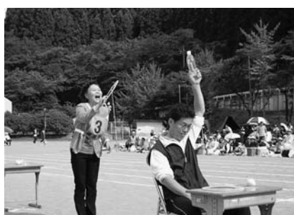
あー 同じものじゃない