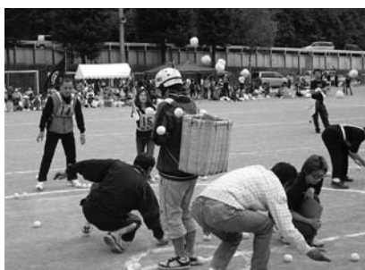
たくさん玉を入れてね