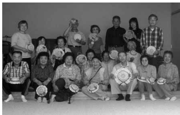
世界に一つの作品です…