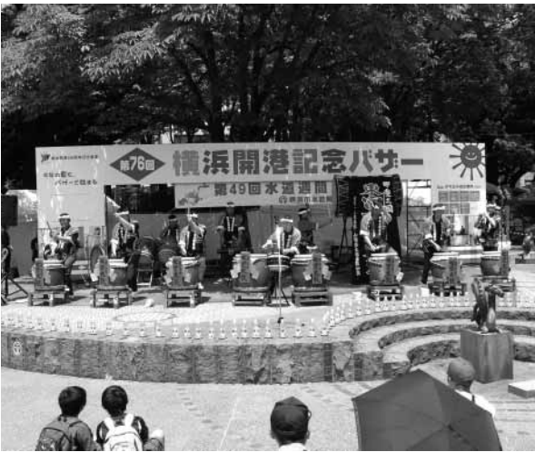
東富士七里太鼓もイベントで演奏を披露しました