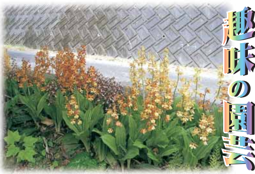
エビネラン 出羽 和春 (笹久根)

ラン科で多年草、丸い地下茎はエビの様な姿で横に連なっているのをエビに見立てたと言います。