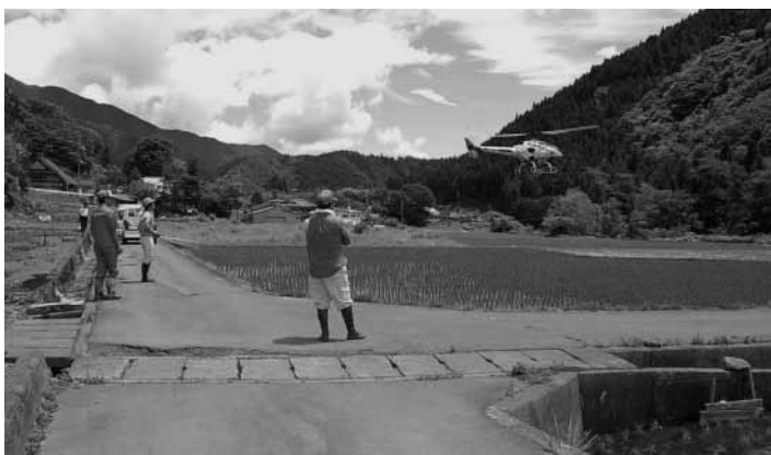
ヘリコプターによる消毒の空中散布(谷相地区)

6月15日農済富士によるイモチ病の消毒が村内全域に亘り実施されました。当日は農済の職員、道志村の役員等25人程参加して消毒しましたが、広い水田においては環境に配慮しながら、散布作業の効果を確認するため、リモコンヘリコプターを使用して空中散布消毒が行われました。