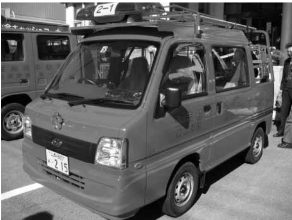
第二分団第一部(樺地区)