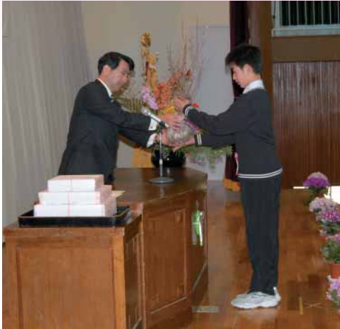
道志小学校卒業式で贈呈

道志村では、四季豊かな地域景観を創造するため「ふるさとづくり花いっぱい運動」を推進しています。この運動は、地域住民と行政が一体となり自分たちの住む地域を美しくすると共に、花や木を育て合わせて「思いやりの心」を育てていただくことを目的に「道志村ふるさとづくり花いっぱい運動」として推進しているものです。