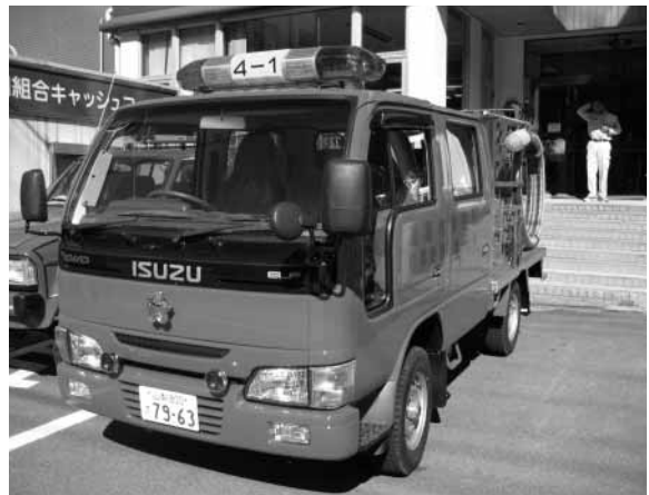
第四分団第一部(善之木地区)