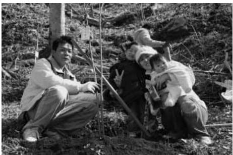
子供の出生記念に