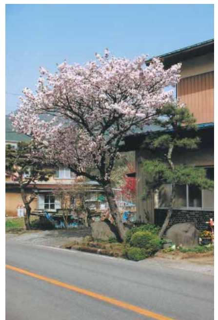
上善之木地区の桜