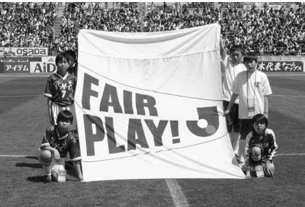
フェアプレーフラッグ掲揚

結果は残念ながらヴァンフォーレ甲府の惜敗となりましたが、今シーズン昇格後初のJ1舞台においても、上位チームを破ったりと、シーズン途中ですが試合内容は高い