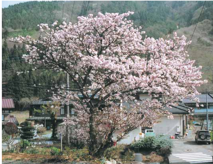
下善之木地区の桜