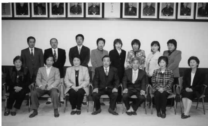
新民生・児童委員の方々

民生委員・児童委員は、社会福祉行政に携わるために、厚生労働大臣から委嘱されるもので、地域住民の社会福祉への関心を高め、きめ細かい社会福祉サービスの提供するものです。また、児童委員としても、児童及び妊産婦の健全育成のための地域活動を自主性、奉仕性をもって行うものとされます。