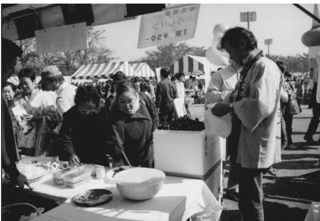
道志村特産品のクレソン、酒まん、味噌、サシミこんにやく等の即売を行う。