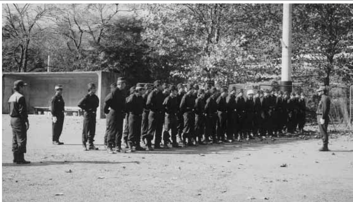
訓練を受ける消防団員

去る十一月十三日午前九時から、午後三時まで村民グラウンドにおいて移動消防学校を開催いたしました。訓練においては、専任消防教官二名の講師をまねき、消防団員として厳正な規律を身につけ、消防諸般の要求に適應できる基礎を身につける訓練を実施いたしました。 ※消防団員は、住民の生命と安全・財産を守る為にこれからも訓練等を実施していきます。