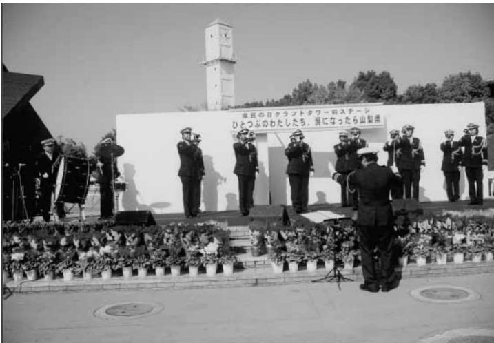
ステージにおいてラッパ隊の演奏

平成十七年の成人式については、一月九日（日曜日）午後一時から中央公民館二階大会議室において開催されますので新成人となる皆さん全員ご参加ください。 新成人は次のとおりです。（計十六名）