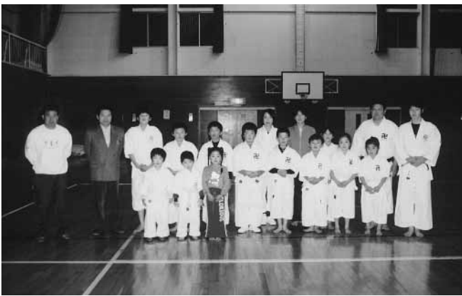
少林寺拳法スポーツ少年団と関係者