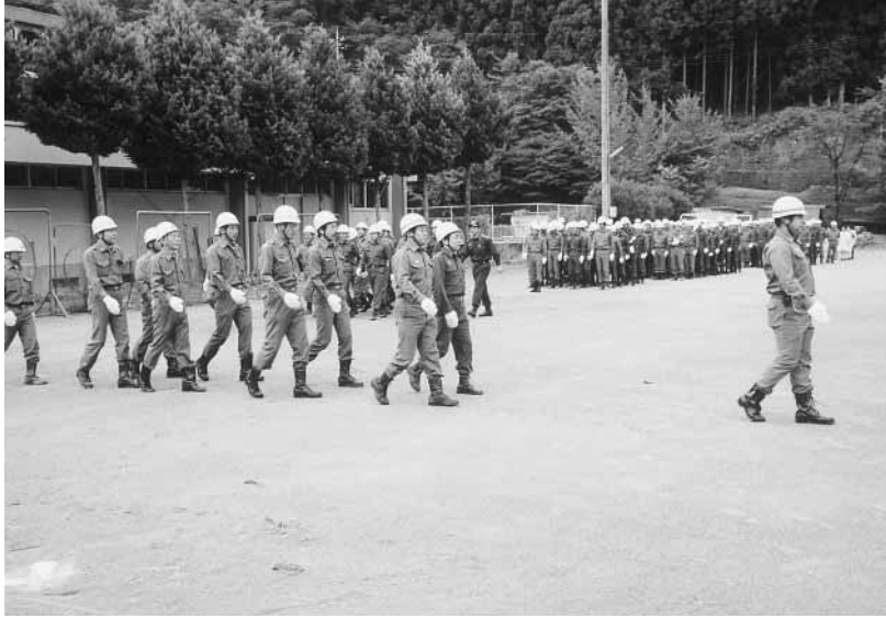
消防団員による分列行進