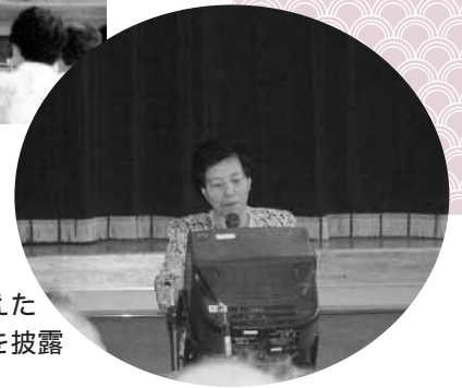
日頃からきたえた カラオケを披露