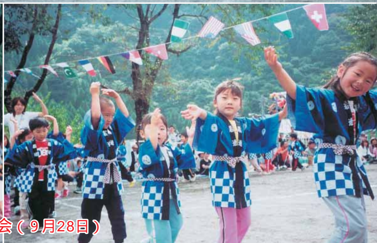
保育所運動会（9月28日）