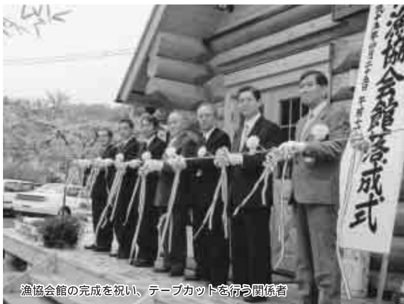
漁協会館の完成を祝い、テープカットを行う関係者

造二階建てのログハウス式、一階漁 協事務所などに、二階については、 小、中学生が野外学習に訪れた際に 利用できるような体験学習室など、 機能をあわせた多目的施設として建 設いたしました。延べ床面積は、二 百五十七平方メートルです。