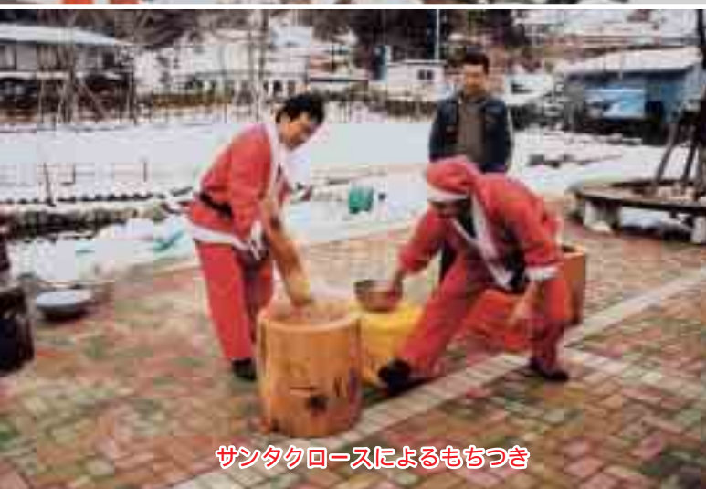
サンタクロースによるもちつき