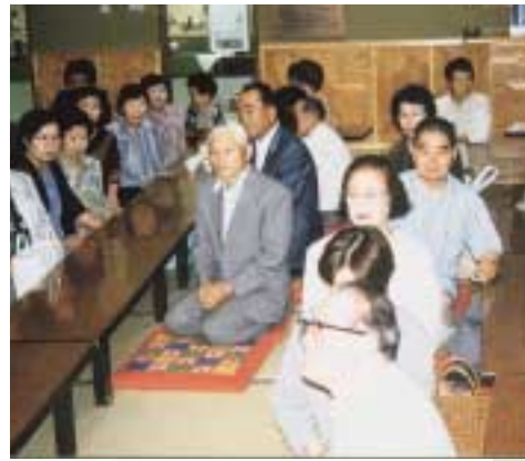
道志の湯大広間にて