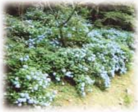
アジサイ 東神地 観光農園