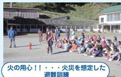
火の用心!!・・・火災を想定した避難訓練

11月13日、職員室から出火したことを想定した避難訓練をしました。「おはしも」を守って全員無事に校庭に避難しました。消防署の指導のもと、消火器の使い方も教わりました。これから空気が乾燥し、火災の多い季節になりますので、お家でも気をつけて下さい。火災の原因の第一位は「放火」、第2位は「たばこ」だそうです。お互いに注意したいものです。