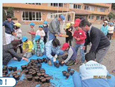
「どんぐりプロジェクト」始動!

11月28日に「道志小と万騎が原小で川井浄水場にどんぐりの森をつくろう!!」というプロジェクトが始まりました。今年度は、万騎が原小の子どもたちが拾ったどんぐりを道志小の子どもたちが種まきをしました。一人2個ずつポットにどんぐりを埋めました。計画では、平成30年度に、どんぐりの苗を川井浄水場に植樹する予定です。