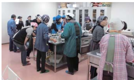
いつもともちょっと違う調理法でしょうか?