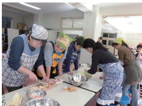
かなり細かくきざむんだよ!!