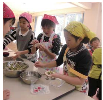
ぎょうざ作り楽しい!!

12月13日(土)に小学校で親子料理教室を行いました。参加者は35名。子ども達は保護者や食生活改善推進員と会話しながら、野菜きざみやぎょうざ作りを楽しみました。今年は生活習慣病予防を課題にして、ヘルシーメニューに慣れるよう『五穀ごはん』に『野菜たっぷりぎょうざ』『きのことワカメの中華スープ』『桃杏仁』のメニューでした。