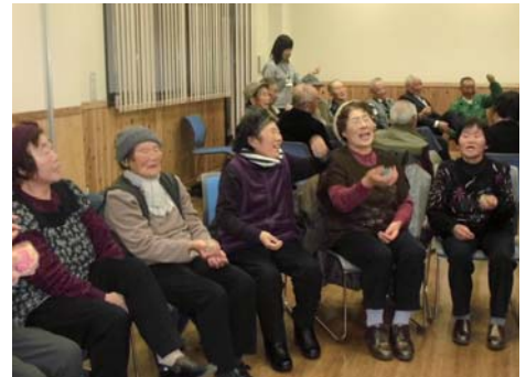
長生きのひけつは“笑い”!!

センターで、社会福祉協議会・住民健康課が主催となり、民生委員、あすなる会の協力をえて、総勢90名が参加しました。お手玉渡し・親指運動・甲州弁体操などで盛り上がり、昼食には、握りずしや、食生活改善推進員による浅漬け・けんちん汁が提供されました。そして大正琴、歌、保育所児の劇と踊り、フラダンスの発表が行われました。議会からクリスマスケーキが送られ、サンタクロースからは参加者一人ひとりにプレゼントが手渡され、ひと足早いクリスマスを楽しみました。