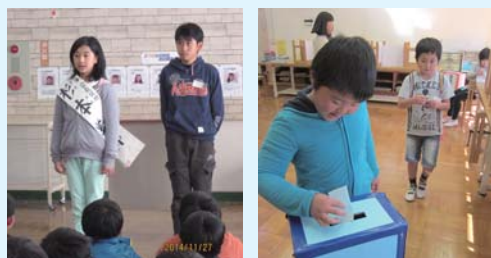
来年は私たちが・・・「児童会役員選挙立会演説会」

平成27年度の児童会役員を決める選挙の立会演説会及び投票開票が11月27日に行われました。どの候補者も自分の考えや方針をしっかりと伝えようと、真剣な表情で訴えていました。また、初めて選挙をすることになった3年生は、緊張しながら投票していました。当選者の3名には、来年の道志小学校を引っ張るリーダーとしてがんばって欲しいです。