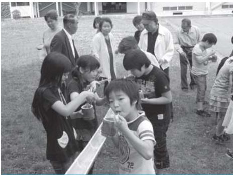
流しそうめんおいしいなあ!! おじいちゃんもおばあちゃんも食べてみて!!

6月14日の午後、祖父母参観を実施しました。80名以上の祖父母を向かえ、最初に体育館での全体会を行い、その後各教室でおいしいちゃんやおばあちゃんに手伝ってもらいながら授業を行いました。 1年生「七夕飾りづくり」 2年生「よもぎだんごづくり」 3年生「昔のあそび」 4年生「マイ箸づくりと流しそうめん」 5年生「うどんづくり」 6年生「修学旅行と今と昔」 今年もたくさんのおじいちゃんやおばあちゃんの方に来ていただき、子どもたちは一緒に学習できてとても喜んでいました。本当にありがとうございました。