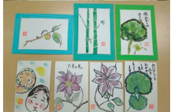
やまゆりセンターに展示してあります。ぜひ、見に来て下さい。