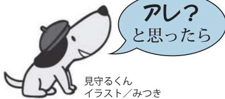
見守るくん イラスト/みつき

購入後は契約をおおった業者とは連絡がつかなくなり、実際に買い取りがされた事例はなく販売業者に返金を求めていることがほとんどです。