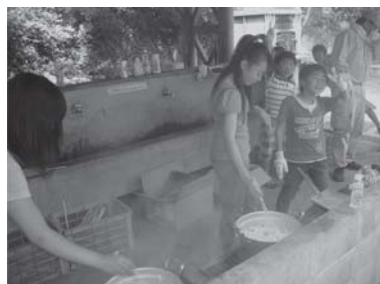
火を使ったご飯づくりは、なかなか経験できないもの。いい思い出になりました。

ら道志の自然や歴史について教わりました。午後は道志の湯に入った後、キャンプファイアーでは、自分たちでいろいろなアイディアを出し、思い切り楽しんでいました。二日目は、ネイチャーゲームをした後、飯ごう炊さんでご飯とカレー作り奮闘しました。慣れないまきを使つての昼食づくりでしたが、みんな一生懸命働き、とてもおいしいご飯とカレーができあがりました。秋の横浜訪問に向けて5年生の団結力が高まった自然教室になりました。