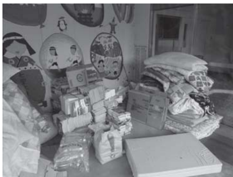
善之木体育館の入り口付近 (6月21日撮影)

今後、このような状況が続きます と、収集場所の変更をお願いするこ ととなりますので、ご協力下さい。