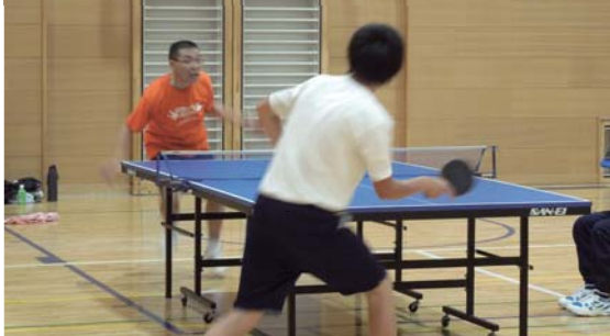
世代を超えた熱戦が繰り広げられました