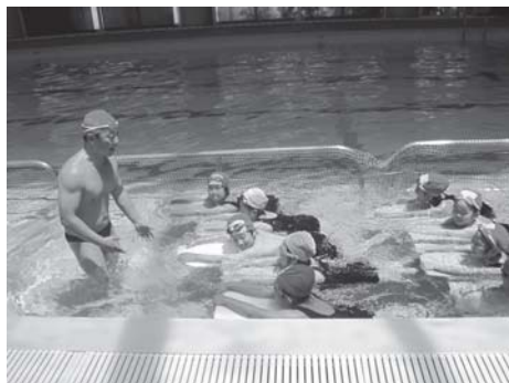
1年生はビート板からスタートです。 これから練習してたくさん泳げるようになるぞ!!