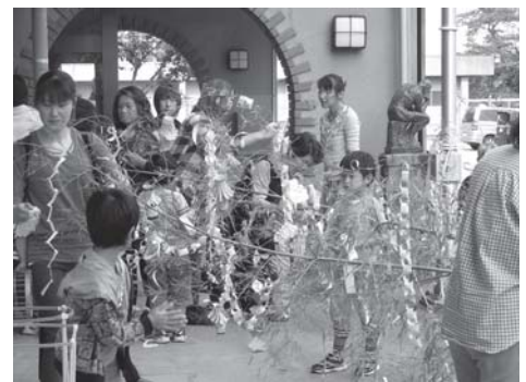
七夕さまにどんなお願いしたのかな? みんなの願い事がかないますように!!

また、この水泳教室に向けて、道志小教職員は6日に都留市消防署の方の指導のもと心肺蘇生法講習