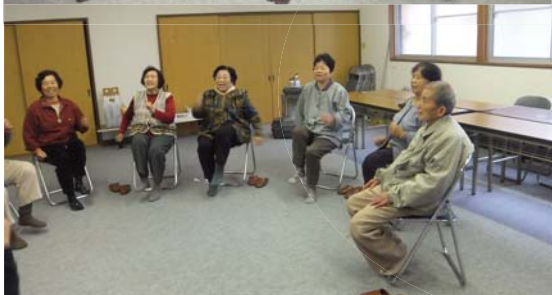
おいしいお茶と運動で身も心もほぐれました