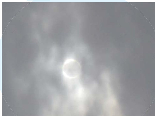
5月21日、金環日食が道志村でも 見られることができました！！ (みなもと体験館 午前7時35分頃 撮影)