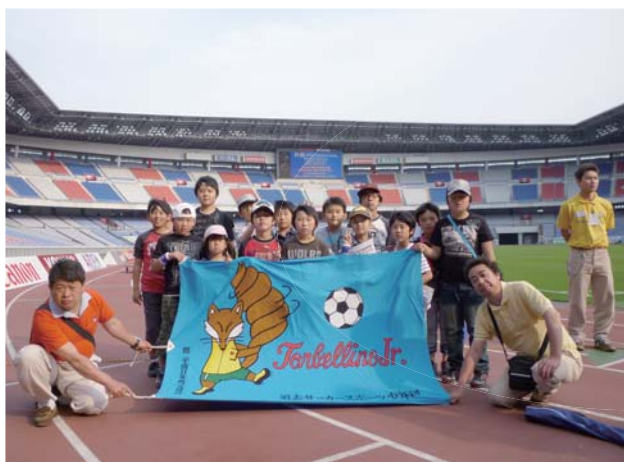
日産スタジアムのピッチにて記念撮影