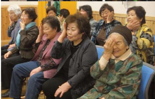
レクを楽しむ参加者