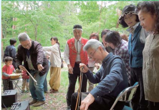
珍しい楽器に来場者は興味津々です