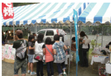
ほたる祭り物産展