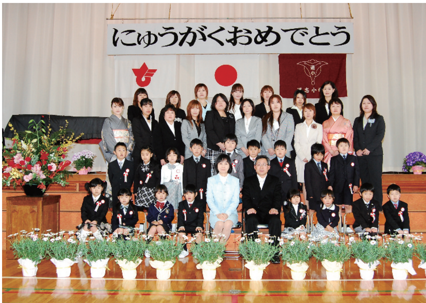
道志小学校入学式 入学児童 17名 (男児 10名・女児 7名)